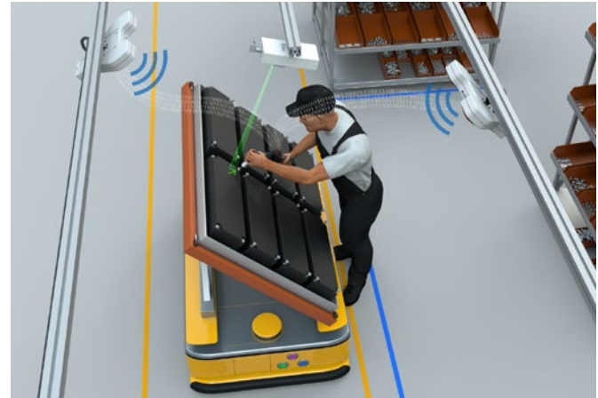
Utilizando el sistema de Sarissa, la batería se puede posicionar ergonómicamente.