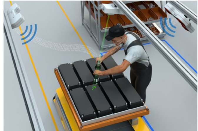
El AGV se detiene en varias posiciones y el transmisor de herramientas de Sarissa se refiere a un sistema de coordenadas en movimiento.