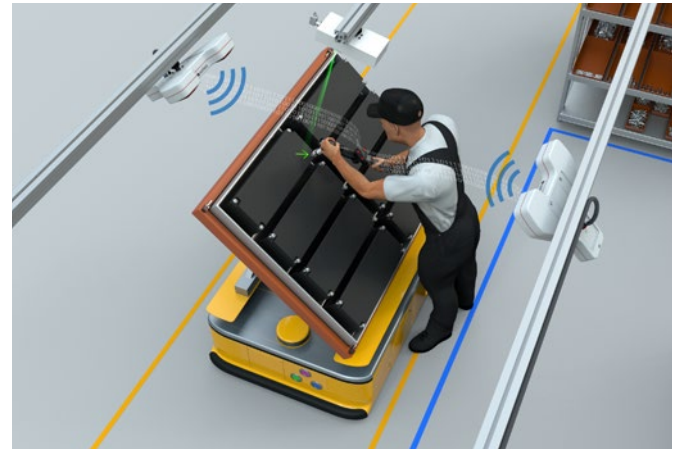
Atornillado de un módulo de batería en un ángulo determinado.

La herramienta se bloquea o se libera desde una posición controlada, o recibe diferentes conjuntos de parámetros. La tecnología de sensores de Sarissa se caracteriza por su capacidad de determinar de forma fiable la posición de los tornillos adyacentes con una precisión de sólo unos pocos milímetros, incluso si el transmisor se aleja del receptor hasta 70 grados. Bajo ciertas condiciones, se permite girar hasta 90 grados lejos del receptor.