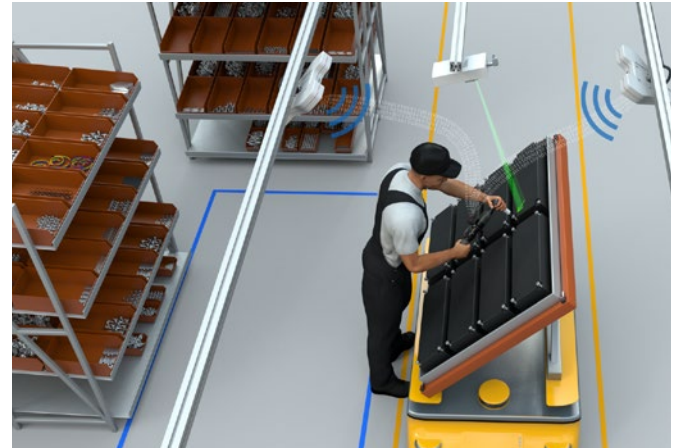
Las piezas de trabajo en movimiento en el flujo de producción son referencia por el Sistema de Posicionamiento Local.