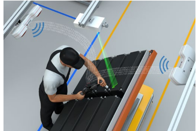
Sarissa entrega coordenadas de manera confiable en cualquier posición.

Para poder alcanzar posiciones de atornillado de forma más ergonómica, los módulos de batería deben girarse en un cierto ángulo. Independientemente de la posición o el ángulo de la pieza de trabajo, el LPS de Sarissa proporciona las coordenadas asociadas para cada posición de tornillo. Ya sea dentro de la línea de producción con un gran número de variantes o en estaciones de retrabajo, el uso del sistema de asistencia y detección de posición de Sarissa asegura la prevención de errores de montaje provocados por errores humanos.